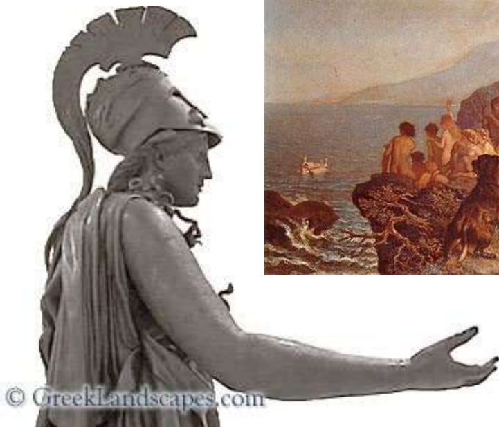
Athéna (Piraeuszi Régészeti Múzeum, Athén).